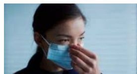
4. Pressiona la tira metàl·lica per ajustar-te-la al nas.